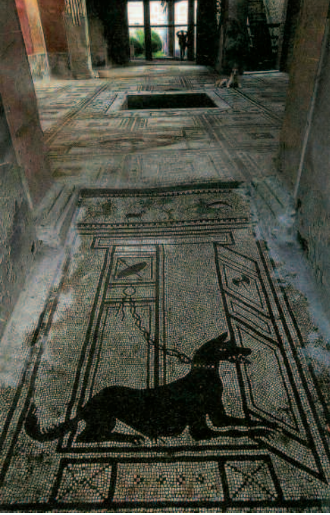
SOLDA "Mozaik Denizi" kitap kapağı