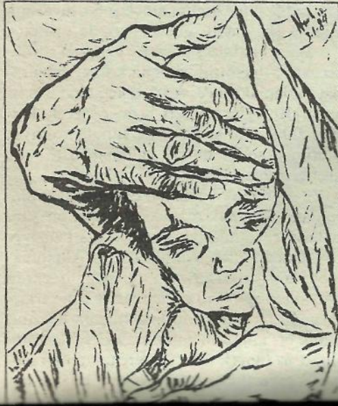
Desen : Nevhiz Tanyeli