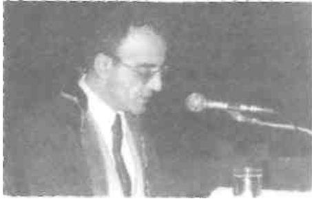
İzmir Barosu 1981 yılı olağan Genel Kurul Toplantısı 19 Aralık 1981 Atatürk Kültür Merkezi-İzmir

DİNÇ: Ödüllendirilmek, elbette güzel bir olay. Ben yeteneklerine güvenen bir kişi değilim. Zaman zaman yararlı bir şeyler yapabildiysem, bunların tümü yoğun uğraşların ürünüdür. İşleri olağan akışına