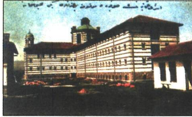
"Sofya Cezaevi" - "Osmanlı esirlerinin Sofya'da buldukları yeni cezaevi" D. Bajdaroff, Sofya