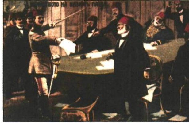
"Nazım Paşa'nın öldürülüşü"