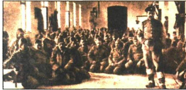
"Bulgar kışlasında Türk esirler"