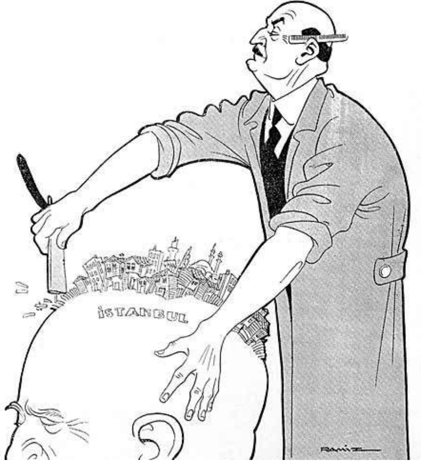
Ramiz Gökçe Köhne İstanbul'dan kurtuluyoruz... Karikatür, 6 Ekim 1938, S. 145

İnsanlar barındıkları konutlarından başlayarak, çevrelerinde ve yaşadıkları kentlerde neleri görmek isterler? Her gün işe, alışverişe yada gezmeye gitmek için sokağa çıktıklarında nasıl bir ortama karışmaktan mutluluk duyarlar? Kentleşme yalnız nesnel bir birikim olmadığı gibi, kentlilik de kişinin başını