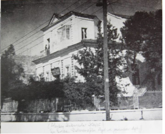
1960'lardaki Özel Yamanlar Koleji binası

Böylelerine göre daha az görkemli, ama yine de gösterişli ve zengin konutu kimliğinde evler, İzmir Kordonunda yanyana dizilmekle kalmaz, Karşıyaka yalısında da, bahçelerini öne sürerek, cephe tutarlardı.